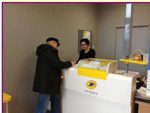
Agence Postale Communale