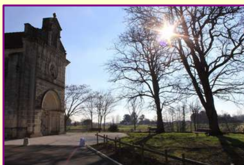
Rénovation parvis de l'église